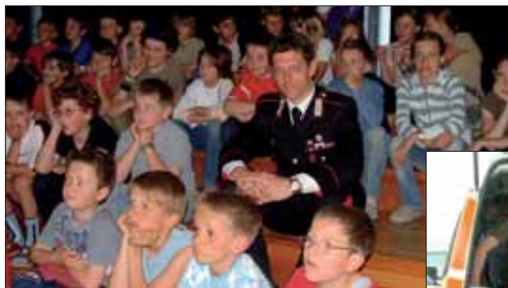
oben: Ein echter Carabinieri inmitten der Kortscher Grundschüler

Besuch ab. Er zeigte in einem Kurzfilm die wichtigsten Aufgaben und Einsatzgebiete der Carabinieri. (ir)