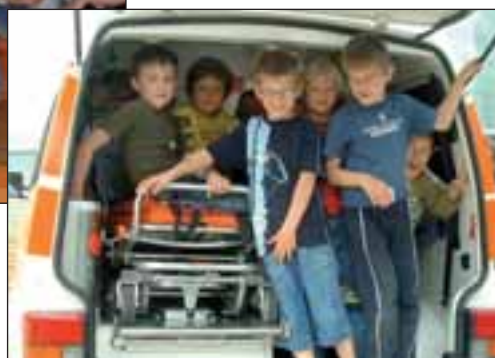
rechts: Kinder inspizieren den Rettungswagen des Weißen Kreuzes genauestens